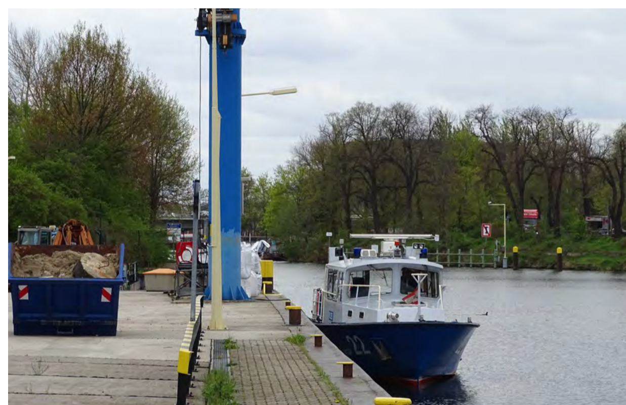
Die Wasserschutzpolizei stellt den Transport über die Wasserwege zur Verfügung