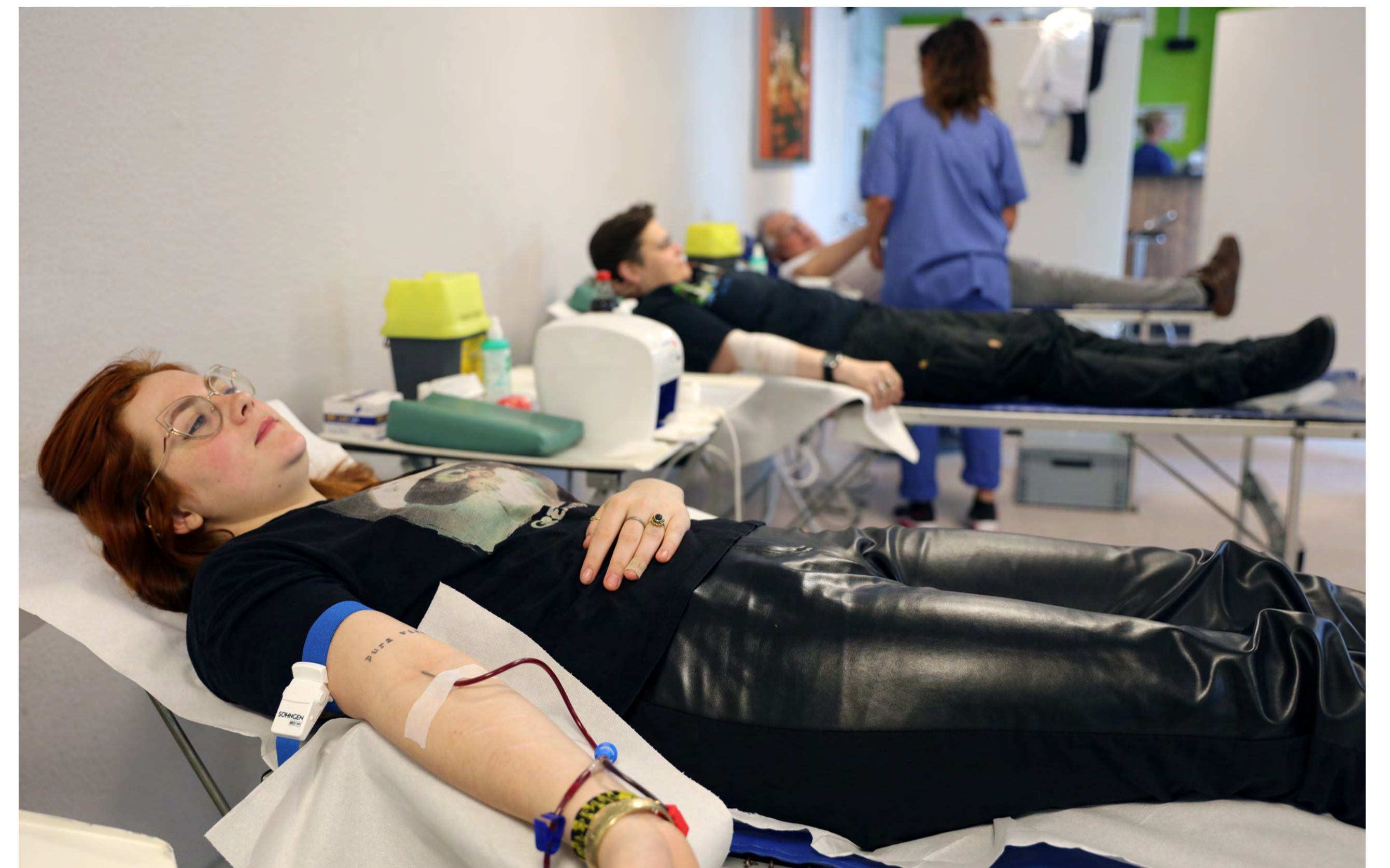
Die mobile Blutspende wurde gut angenommen.

Im Fall unterbrochener Verkehrsverbindungen muss der Zugriff auf alternative Transportwege möglich sein.